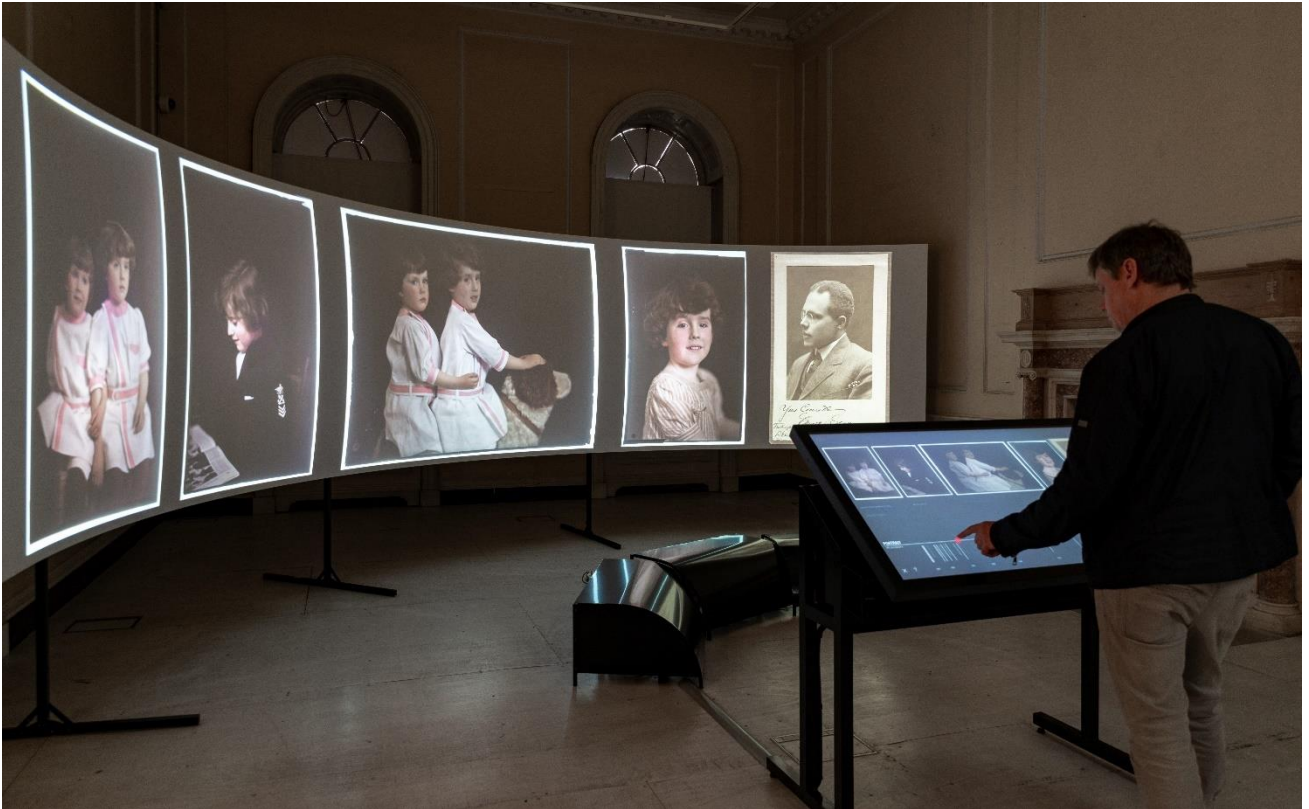
Système panoramique itinérant de présentation d'une collection photographique – Londres, 2018