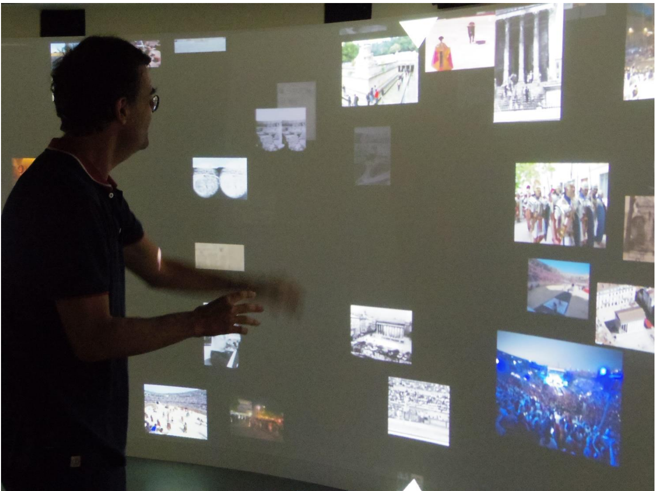
Exploration gestuelle collective dans un corpus documentaire – Musée de la Romanité de Nîmes, 2018