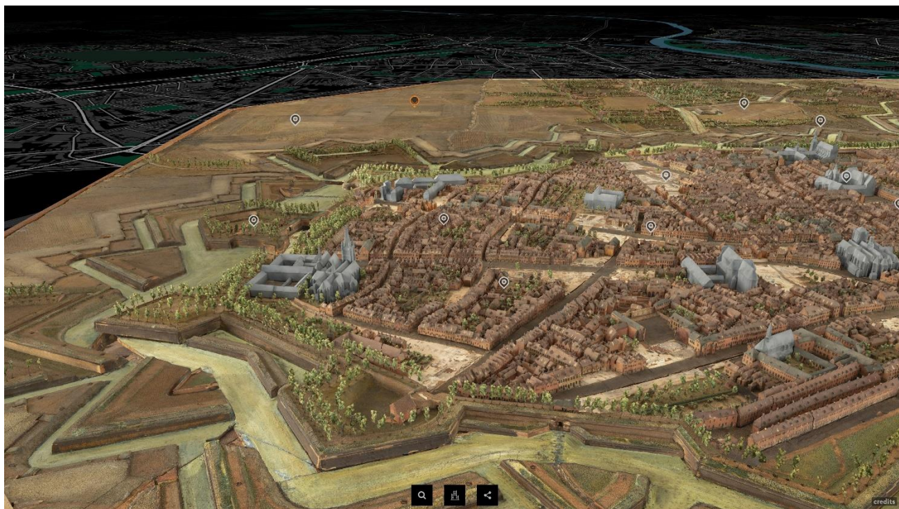
Exploration interactive du plan-relief de Lille numérisé en 3D – Palais des Beaux-Arts de Lille, 2019